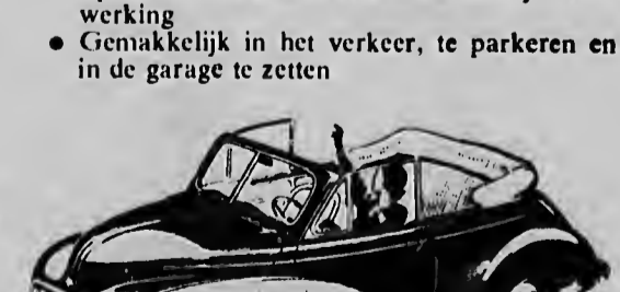
Morris Minor Cabriolet